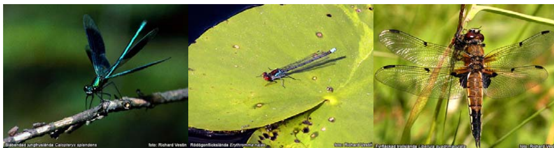
BILD 5. Det finns tre grupper trollsländor i Sverige: Jungfrusländor, flicksländor och äkta trollsländor. I vårt land finns bara två arter av jungfrusländorna som oftast håller till vid bäckar och rinnande vatten. Flicksländorna är betydligt vanligare och återfinns vid sjöar och dammar. Det finns flera arter i olika färger. Hanarna är oftast blå med svarta teckningar emedan honorna har liknande teckningar fast med brungrön bakgrundsfärg.

Av världens omkring 5000 trollsländearter, har man i Sverige funnit 61 arter. Då många europeiska trollsländor till följd av ett förändrat klimat expanderar sina utbredningsområden norrut, är det bara en tidsfråga innan fler arter upptäcks i vårt land. Av Europas cirka 164 arter är över en tredjedel hotade, primärt som en följd av att deras livsmiljöer försvinner.