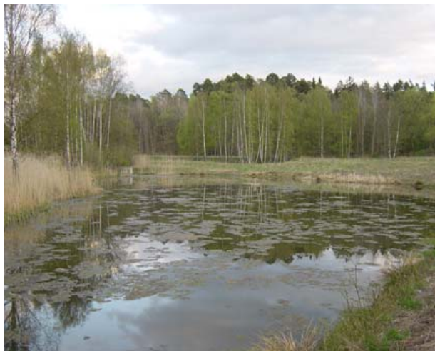
BILD 4. Banskötsel med höga givor närsalter kan göra dammarna på golfbanan direkt otjänliga för våtmarksberoende organismer. På bilden syns kraftig algblooming som täcker dammens yta.

Långt ifrån alla svenska golfbanor är dock groddjursvänliga. I synnerhet om de inte uppfyller de tre kraven ovan. Dessutom kan en banskötsel med höga givor närsalter göra dammarna och andra habitat på golfbanan direkt otjänliga för de våtmarksberoende organismerna. Förhöjd halt av närsalter (eutrofiering) gör att endast ett fåtal vattenlevande smädjur gynnas på andra, känsligare arters bekostnad.