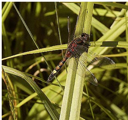
BILD 6. Inventeringen av dammar i stor-Stockholm visade bland annat att golfbanornas dammar hyser flera arter av trollsländor. Bilden visar en hane av den citronfläckade kärrtrollsländan som trivs i många golfbanedammar. Arten är fridlyst inom hela EU, men är inte rödlistad i Sverige. I Västeuropa har citronfläckad kärrtrollslända gått starkt tillbaka, troligen på grund av ökat kvävenedfall och markexploatering. Därmed har Sverige ett särskilt ansvar för artens fortlevnad.

larven är tämligen lik den vuxna sländan och saknar puppstadium vilket gör att det vuxna djuret kläcks direkt ur det sista larvstadiet.